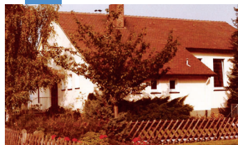
1951 Gemeinde Waddenhausen