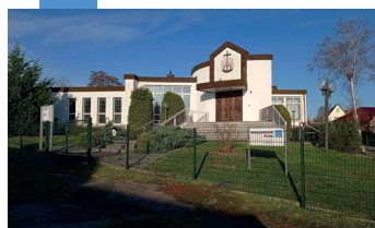
18. August 1993 Einweihung durch Bezirksapostel Ehlebracht.