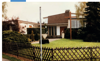
1964 Einweihung Kirche Bandelstraße 30. August 1992 Letzter Gottesdienst vor dem Umbau.