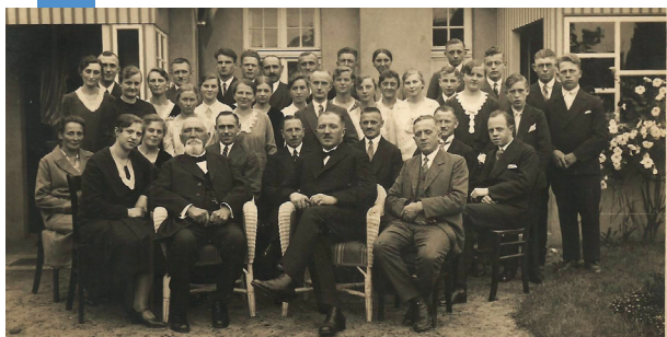
1931 Die 2. Gottesdienststätte in Lage Lange Straße 114. Gemeinde Lage mit Stammapostel Niehaus