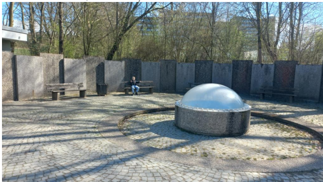
Frühstücksplatz am Wildgehege/ Kurpark