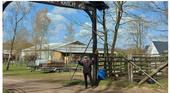
Mittgaspause auf der Silberranch