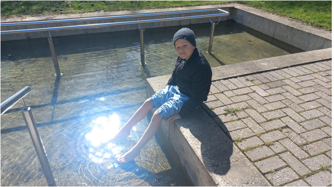
Rast am Wassertretbecken