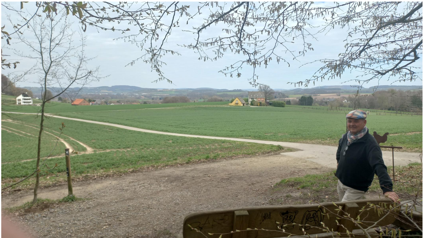
Schöne Aussicht am Hühnerwiem