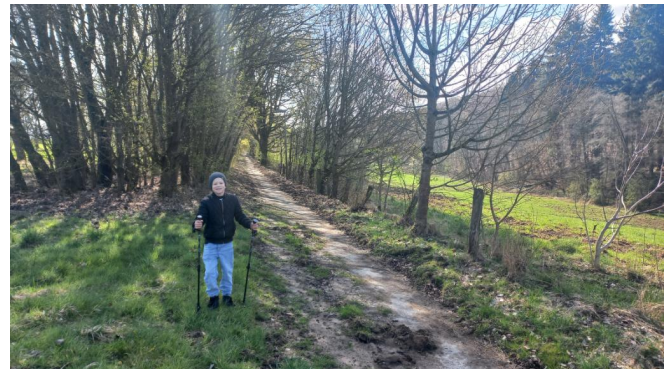
Vom Golfplatz zum Kurpark