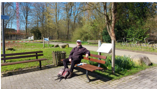
Rast am Wassertretbecken (Kurpark)